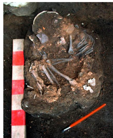
Figura 4. Alero Marifilo-1, enterratorio de un niño en niveles del Arcaico Medio.

Investigaciones efectuadas en la costa de Valdivia ha permitido la definición de redes de relaciones de apropiación y uso de los distintos microambientes costeros de Chan-Chan (X Región) en los que es posible observar el desarrollo de principios de territorialidad desde el Arcaico, particularmente desde el Arcaico Medio 33 . Esta apropiación ocurriría en forma de mosaico en los ecosistemas cercanos, pero también influida por recursos de otras áreas: cordilleranas y de mares interiores o marginales. Chan Chan-18 datado entre 5600 A.P. y 5000 A.P., asocia contextos de aprovechamiento de fauna marina, avifauna costera y recursos del bosque locales, así como la presencia de recursos alóctonos 34 .