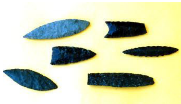
Figura 5. Playa de Chan-Chan, vista Figura 6. Chan Chan 18, puntas de proyectil.