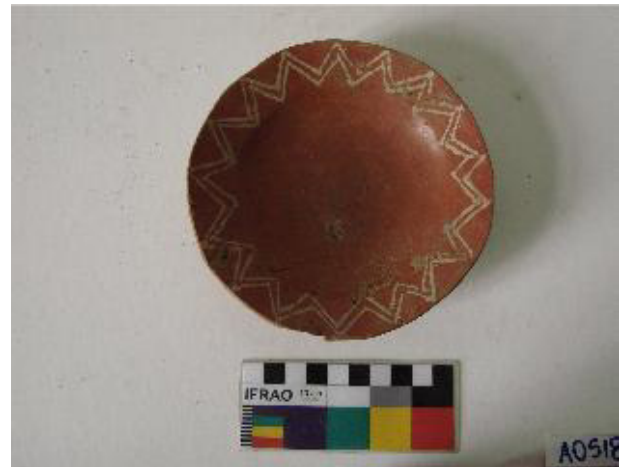
Figura 15. Jarro con decoración Tringlo. Colección MHAMVM-UACH