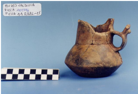
Figura 11. Jarro bitroncocónico con Figura 12. Modelado antropomorfo. Colección Colección MHAMVM-UACH. MHAMVM-UACH.

En la costa, entre Maiquillahue y Curiñanco se ha documentado un conjunto de sitios alfareros, todos ellos abiertos y probablemente correspondientes al Alfarero Tardío. Entre las playas de Calfuco y Curiñanco, sobre grandes y escarpados roqueríos, se ubica el alero Ollita Encantada. Los sondeos realizados presentaron evidencias de depositación malacológica, material ictiológico, esquistos y clastos provenientes de afloramientos costeros, además de abundante material cerámico. Destaca la presencia de un pequeño anzuelo de hueso de unos 4 cm de largo. Se obtuvo dos dataciones sobre cerámica, que permiten adscribirlo al período Alfarero Temprano entre los años 800 y 1000 DC. Los antecedentes recuperados, si bien iniciales, son de gran relevancia pues documentan por un lado ocupación de aleros en ámbitos costeros de la zona valdiviana que no habían sido documentados y, por otra parte, la ubicación cronológica en el Alfarero Temprano que es probable en algunos casos presente una mayor profundidad temporal.