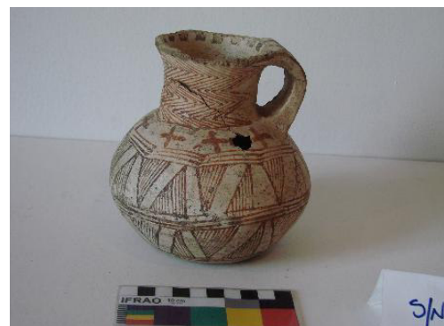
Figura 14. Jarro Valdivia. Colección MHAMVM-