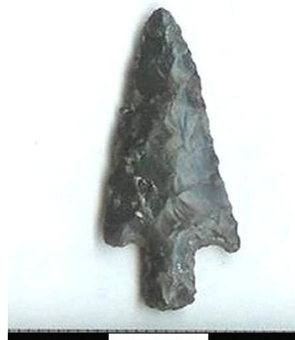
Figura 8. Rinconada Challupén, punta de proyectil.