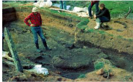
Figura 1. MV-II vista general de las excavaciones junto al estero Chinchihuapi. Figura 2. Al centro estructura con forma de espoleta.

Los restos líticos recuperados del asentamiento configuraron un patrón distinto a la noción dominante de aquel entonces sobre las industrias líticas de las poblaciones paleoindias. En el conjunto lítico de Monte Verde-II dominan las materias primas locales con modificaciones mínimas. Entre las escasas herramientas líticas destacan tres fragmentos de puntas líticas conservadas que se asemejarían a aquellas descritas para El Jobo en Venezuela. De acuerdo al autor, “la relativa escasez de desechos grandes de talla tiende a confirmar que el trabajo de la piedra no le aportó tanto a la comunidad con el trabajo en la madera ...La presencia de instrumentos líticos no originarios de esa región confirma que los residentes recorrían grandes extensiones del territorio, desde la Cordillera de los Andes hasta las playas del Pacífico” .