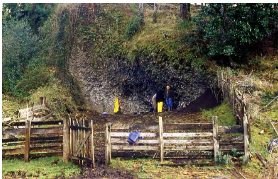
Figura 3. Alero Marifilo-1, vista general.

la explotación de materias primas, la explotación de mamíferos solitarios, de pequeño y mediano tamaño, así como aves de hábitos acuáticos, posiblemente con trampas, complementada con la recolección de vegetales y moluscos dulceacuícolas. Esta forma de habitar el bosque expresaría estrategias conductuales específicas de estos ambientes, con una larga existencia comprendida entre los 10.000 y los 2.000 años AP. Es importante señalar además que si bien la singularidad de estas ocupaciones se distancia, particularmente en las tecnologías líticas como en aspectos de su modo de vida, de aquellas descritas para la costa durante el Arcaico Medio, como es el caso de Chan Chan-18 en la misma cuenca, comparten un patrón funerario expresado en la posición y ajuar de los individuos. Ello plantea interesantes interrogantes para comprender la complementariedad en el uso del espacio regional, las estrategias de movilidad y rutas empleados, así como sobre la existencia de variabilidad en las estrategias de asentamiento y subsistencia de estas poblaciones.