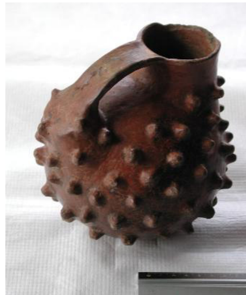
Figura 10. Jarro Asimétrico con representación zoomorfa, Complejo Pitrén. Colección MLR.

En el valle o depresión intermedia se han reconocido cementerios Pitrén en tres tipos de emplazamiento. De norte a sur, el primero de ellos corresponde a aquellos yacimientos localizados en sectores montañosos, particularmente en el cordón Mahuidanche-Lastarria. Allí se han descrito los sitios Lau Lao y Collico-1 en la comuna de Loncoche y Lahuán-1 en la comuna de Lanco. Los sitios se encuentran en laderas o cimas de cerros y los conjuntos alfareros son eminentemente monocromos. La única fecha