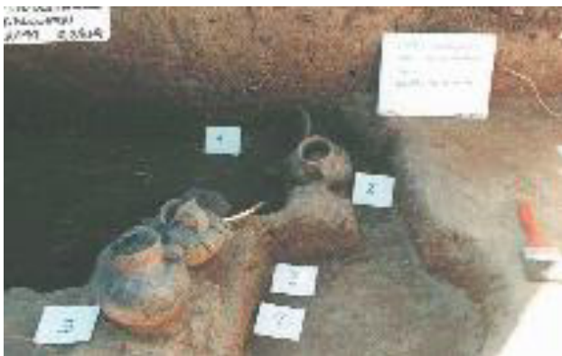
Figura 7. Sitios Los Chilcos, conjunto cerámico.

Una tercera categoría de sitio que hemos documentado en esta localidad son los aleros. Nuestros trabajos hasta la fecha se han concentrado en la costa norte del lago en los sitios Cueva Challupén Alto-1, Huirilef-1, Ñilfe-1, Marifilo-1, Loncoñanco-1 y Los Resfalines-1. Marifilo y Loncoñanco. Algunos de ellos, como se ha señalado, corresponden a asentamientos con una larga secuencia desde momentos tempranos del Arcaico y con ocupaciones posteriores de grupos alfareros. En ambos casos se cuenta con dataciones correspondientes al Alfarero Temprano propiamente tal y fechas posteriores al 1.300 DC con presencia de cerámica bícroma rojo sobre blanco.